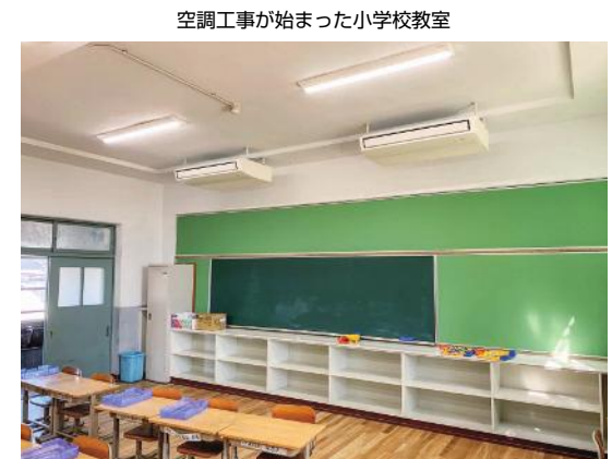
空調工事が始まった小学校教室

民の創意工夫と合意により都市公園を有効活用しようとする考え方が示されている。そこで、宝持西住宅跡地を暫定活用する方策として、地域住民が自らの意思を反映させて利用できる都市公園とすることは如何か。 建設局長 宝持西住宅跡地は財源確保に向けた活用を基本としているが、地域にふさわしい活用の可能性を市全体で検討していく。 ―小学校空調設備整備のスケジュールについて― 問 教育委員会は、昨年の十二月定例会にて小学校空調設備整備事業について、「スケジュールの前倒しな