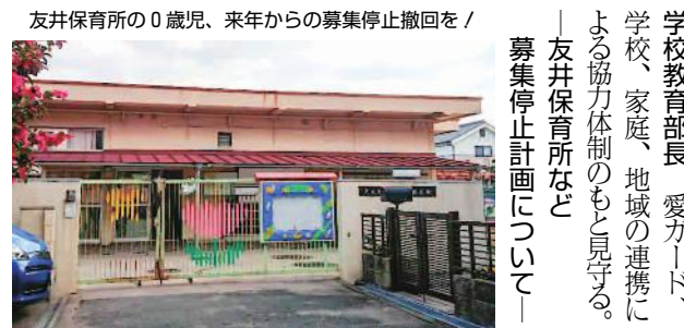
友井保育所の0歳児、来年から募集停止撤回を /

者の中には、稼働能力を高めた方たちが多くおられる一方で、人手不足に悩む中小企業の障害者雇用は増加していない。以前本市では、従業員数五十六名以上で、ハローワークに従業員募集(次頁へつづく)