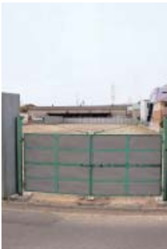
昨年3200万円もの血税を使って途中で整備しながら工事を中断した産業用駐車場用地。( 荒本仮設駐車場 )

市長 本市北東部は救急力が最も弱い地域であると認識している。救急隊の増隊は第三次実施計画に消防署所移転建て替え事業として位置付けている。 ・ 妊婦の無料検診 問 国は今年中に妊婦の無料検診の回数原則二回から五回以上に拡大することを決定した。本市は現在一回のみの実施になっているが、なぜ回数を増やすことができないのか。 健康部長 妊婦健康調査の重要性は十分認識しており、今後とも国の方針に沿った関係部局に働きかけてまいりたい。