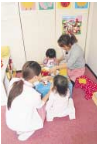
総合病院における看護師の確保に向けて、院内保育所の拡充整備など職場環境の改善が図られます。 (総合病院院内保育所)

問 今年東大阪市文化芸術振興条例が制定される予定であり、市長が市民会館と永和図書館の合築による検討を進めると言及したことから、市民の期待は大変大きくなっている。合築すれば公共施設としてのランドマーク性も高い建築物となることから、市民の利便性や環境に配慮した構造等の基本コンセプトが重要になる。市の見解を示せ。 社会教育部長 両施設については文化芸術活動における拠点となるべき施設として、また市民の利便性を考慮し、近鉄奈良線とJRおおさか東線の二つの駅前となる永和駅前との市民会館用地で複合施設として検討を進めている。