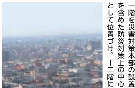
危機管理意識を向上し、市民の生命と財産を守ることが行政の責務です。(庁舎から荒本ジャンクションを臨む)

き市長として判断した。集合工場建設計画、高井田地域に高機能の集合工場を建設する意義は大きく、これを契機に市内での工場開発が活発化することが期待されていたが、市長の対応の遅れから建設予定地の交渉が決裂しその実現性が危ぶまれている。集合工場は高井田地域にあるところ、その効果があると考えますが等価交換等の土地購入方法に知恵を絞る計画を進めるべきではないか。経済部長 集合工場建設事業そのものを断念したわけではない。早急に候補用地