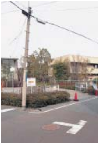
司馬遼太郎記念館の周辺整備を進め、東大阪市のシンボルとして全国にPRしていきます。(司馬遼太郎記念館周辺)

し当初の懸案であった大型バスの一時降車場は整備されているが、さらに充実したものにするため、当記念館入口西側にある朝日新聞東大阪支所を本市が買収し、当記念館を「東大阪市のシンボル」として整備する方針を打ち出すべきである。その上で観光都市東大阪を全国にPRし、多くの人々