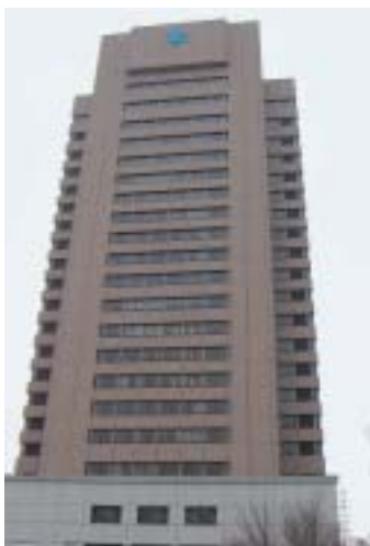
混乱と停滞が続く東大阪市政。打開策は施策の選択と決断が必要不可欠です。市民の願いを市政に反映させるよう取り組みます。(東大阪市総合庁舎)

理事 補助金等見直しの措置状況を把握し、公益性、透明性等の視点で財源不足を補う手法として、税金をむだ遣いするなどの声にこたえるよう見直ししていく。 このほか代表質問の主な項目は、教育再生といじめ問題、市長の専決処分、職員の病気休暇、時間年次有給休暇制度、雨水対策等。